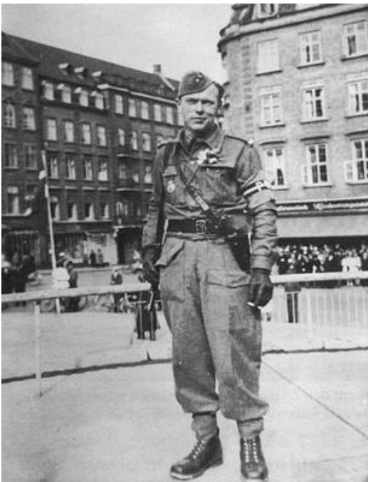
Feltpolitisoldat, Århus, 6. maj 1945.

Delingerne var inddelt i et antal distriktskommandoer, hvis ansvarsområder tilsammen dækkede hele landet. De større distriktskommandoer var yderligere inddelt i et antal sektioner, hver bestående af en sektionsfører og en hjælper. Tanken var, at enheden ved hjemkomsten skulle spredes ud til deres respektive ansvarsområder, og herefter gå i gang med oprydningssarbejdet.