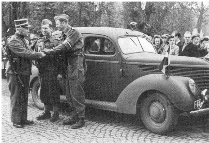
Dansk grænsegendarm og en feltpolitisektion i Kruså, 6. maj 1945. Fra Kilde 4.

Kontrolarbejdet ved den dansk-tyske grænse blev således Feltpolitiets væsentligste indsats, og det lykkedes, sammen med øvrige enheder fra Brigaden, blandt andet at arrestere omkring 1.000 af de eftersøgte personer på den røde liste.